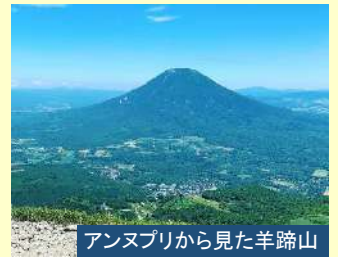
アンヌプリから見た羊蹄山