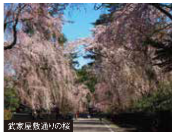
武家屋敷通りの桜

北上川の河畔に位置する北上展勝地は東北有数の桜の名所として知られ、さくら名所100選、みちのく三大桜名所に数えられます。約2kmの桜並木ほかに公園内には約1万本あると言われる桜は圧巻です。