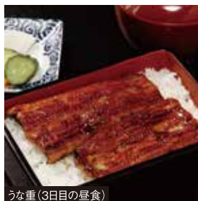
うな重(3日目の昼食)