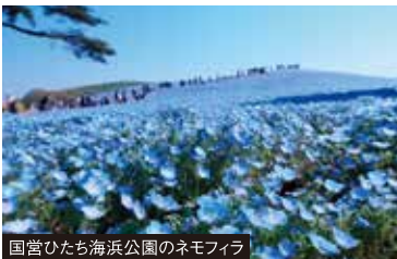
国営ひたち海浜公園のネモフィラ