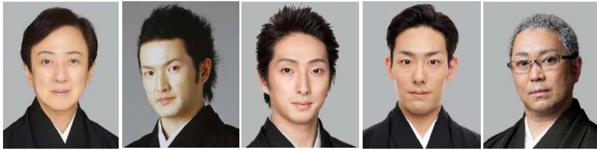
坂東玉三郎 中村獅童 中村七之助 中村勘九郎 尾上松緑

★プログラム・出演者などの内容は主催者側の事情で変更の場合がありますが、当社では一切責任を負いません。出発後に興行が中止の場合、チケット代金以外は払い戻しいたしません。 ★お座席は希望を承ることはできません。当日添乗員よりご案内いたします。