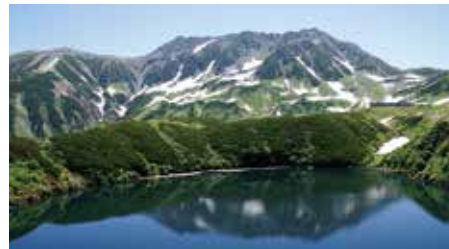
室堂・みくりが池<7月>

上高地では、地元元々 チャーターガイドと散策。世界 有数の山岳観光ルート、立 山黒部アルペンルートで大 自然の絶景を楽しみます。