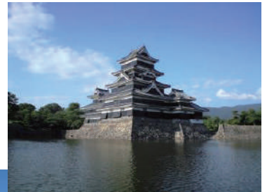
松本城(目的地イメージ)

7か所の提携店で使える500円相当のチケットをホテルチェックイン時にお一人様一枚プレゼントします。