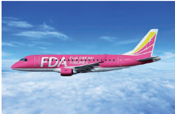
フジドリームエアラインズ(イメージ)