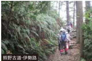
熊野古道・伊勢路