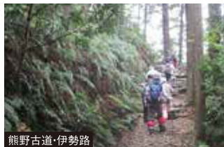
熊野古道・伊勢路