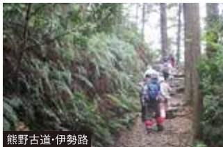
熊野古道・伊勢路