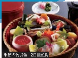
季節の竹弁当 2日目昼食