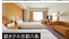
都ホテル京都八条