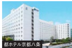
都ホテル京都八条