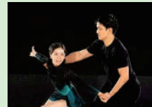
三原瑠来&木原龍一 2023年世界選手権金メダリスト

怪人と呼ばれた青年の思い、そして真実。哀しくも美しい…人間ファントムの物語。あの感動を再びここに!!