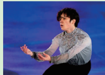
宇野昌磨 2023年世界選手権金メダリスト