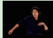
ネイサン・チェン 2022年北京オリンピック金メダリスト