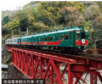
南海電鉄観光列車・天空