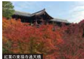
紅葉の東福寺通天橋