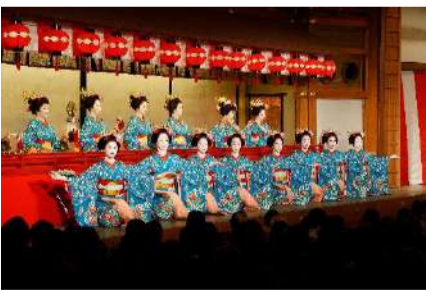
都をどり第1景 (置歌)