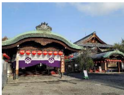
祇園甲部歌舞練場 外観

1・2泊目 京都市内: 京都東急ホテル 洋室利用 (バス・トイレ付) ※3名1室はツインにエキストラベッドを利用。