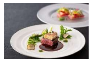
京都東急ホテル外観と一日目洋食 (イメージ)