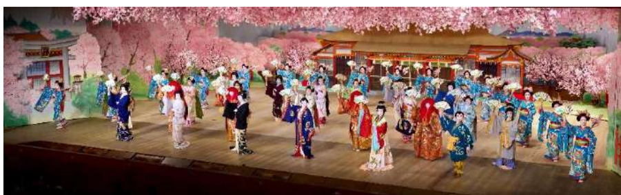
都をどり第8景 (フィナーレ桜の景)