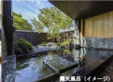
露天風呂(イメージ)

館内は江田島にある日本有数の「紙布(ししゅ)生産工場」で織られた壁紙や瀬戸内海の素晴らしい景色を存分に堪能頂く為お部屋にはあえてTVは置いておりません。客室のお風呂もありませんので大浴場・露天風呂をご利用下さい。