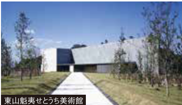
東山魁夷せとうち美術館