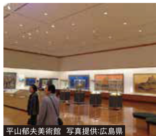
平山郁夫美術館