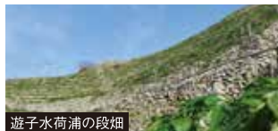
遊子水荷浦の段畑

愛媛から美しい海岸線を走り、高知県足摺岬まで足を延ばし、高知空港から戻ります。四国八十八景に選ばれた愛南町外泊の石垣の里、宇和島水荷浦の段畑など見どころ満載。宇和島の闘牛は迫力満点です。