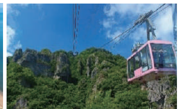
寒霞渓ロープウェイ