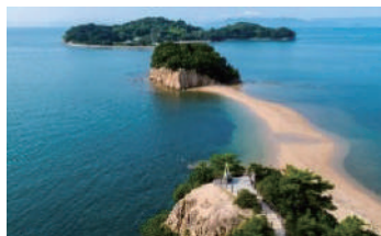
砂の道 エンジェルロード

「四国らしい風景」とそれを「眺める場所」選定し、その魅力を広くプロモートしていくプロジェクトです。