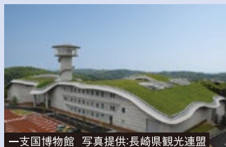
一支国博物館

福岡県と対馬の中間、玄界灘に浮かぶ島。「魏志倭人伝」に記載されている一支国の王都があったとされています。