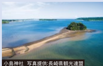
小島神社