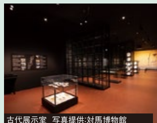
古代展示室