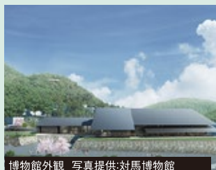
博物館外観

九州と韓国の間、対馬海峡に浮かび「国境の島」と呼ばれている対馬。その地理的環境から歴史や文化といった、対馬独自の数々の遺産を生んできました。2022年4月に開館した「対馬博物館」では、そんな対馬の魅力を自然・歴史・文化まるごと体感できます。