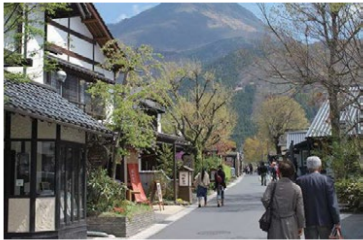
湯布院・湯の坪街道

※瀬の本高原ホテルは温泉街よりバスで10分ほど離れていますが、黒川温泉で唯一の阿蘇山を望む絶景の露天風呂が人気です。