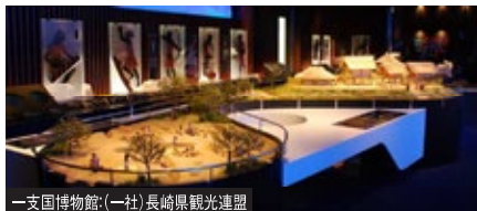
一支国博物館(一社)長崎県観光連盟