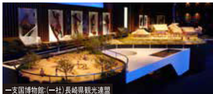
一支国博物館:(一社)長崎県観光連盟