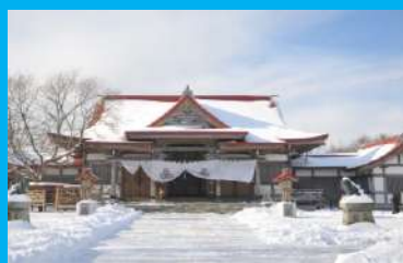
釧路巖島神社

阿寒国際ツルセンターは冬期の間人工給餌を行っており、野生の丹頂が多い時で150羽以上飛来します。研究員が生態・行動の研究を目的とした、国内唯一のタンチョウのための施設でもあります。