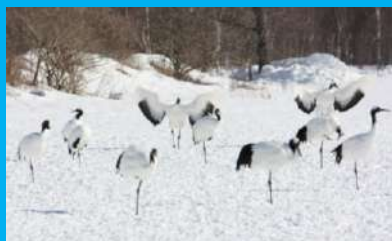
冬の丹頂鶴

山花温泉では地元生産者から直接仕入れる「地産地消」の取り組みに力を入れています。和定食膳をご賞味下さい。