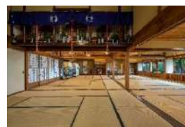
銀鱈荘本館 大広間