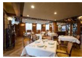
グリル銀鱈荘 店内

かつて漁網倉庫であった建物を使ったレストラン「グリル銀鱈荘」。風情ある趣の中で、旬の食材を生かしたフレンチのコースランチをお召し上がりください。お食事前には鯨御殿の栄耀栄華を令和に伝える、大広間の見学にも特別にご案内いたします。