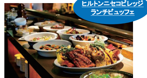
ヒルトンニセコビレッジ ランチビュッフェ

北海道後志管内の5町に点在する5つの美術館・文学館を結ぶ「しりべしミュージアムロード」。地域ゆかりの芸術家をテーマにした個性あふれる施設を、山から田園、そして海へと至る変化に富んだ景観とともに楽しむことができるドライブコースとして親しまれています。