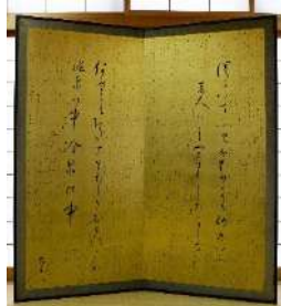
7年振りの展示となる与謝野晶子の「百首屏風」1920年頃(北海道立文学館蔵)

北海道ゆかりの作家と作品に関する資料約26万点を収蔵、展示する北海道立文学館。小説、評論、短歌や俳句、さらにはアイヌ民族の口承文芸まで、19世紀中頃から現在に及ぶ北海道の文学を網羅しています。大正が幕を閉じて間もなく100年を迎えるころから、本展では、有島武郎、石川啄木、萩原朔太郎、三木露風、宮沢賢治、与謝野晶子など、道内外の明治・大正期の著名文学者に着目し、刊行されてからおよそ100年の時を超える所蔵本を一堂に紹介します。