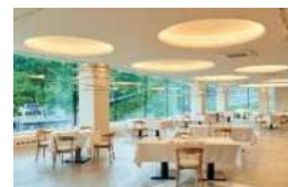
ヌーベルプース大倉山 店内

ヌーベルプースとは、フランス語で「新芽」のこと。シェフは、フランス料理の技法や伝統に和食の文化を加えた、枠にとられない新しい料理の「芽吹き」に挑戦をしています。地産地消をモットーに道産食材を使った料理をご堪能いただけます。