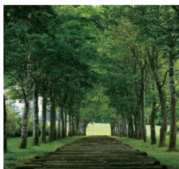
山もみじのトンネル

北海道銘菓としておなじみの六花亭製菓がプロデュース。十勝地方のおよそ145,000平方メートルの広大な敷地内に7館の美術館が点在する「六花亭アートヴィレッジ 中札内美術村」。洋画家・相原求一朗や、日本画家・小泉淳作の美術館の他、企画公募展を行う北の大地美術館などがあります。2017年にオープンした季節の彩りが美しい美術村庭園もお楽しみください。