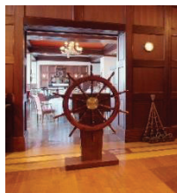
冒険船を模した入口

フランス料理の多彩さと奥深さを気軽に楽しんでいただくことをコンセプトにしたメインダイニング。1960年代に放映されたアメリカのドラマ「ギリガン君 SOS」の冒険物語になぞられた店内で、窓一面に広がる自然を眺めながらゆったりとお食事をお楽しみください。