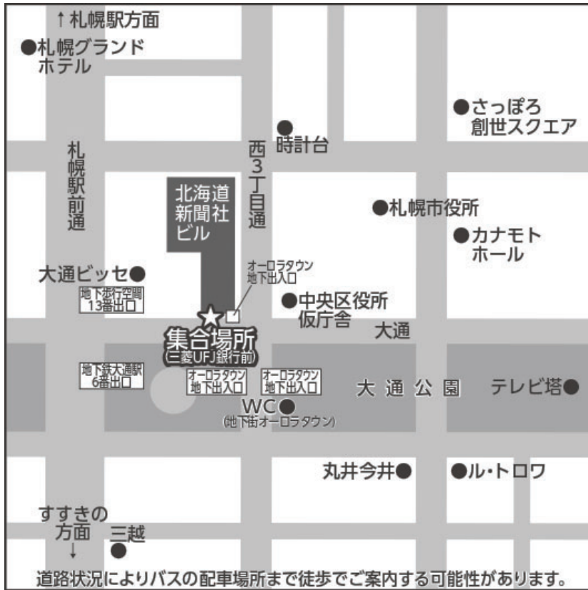
道路状況によりバスの配車場所まで徒歩でご案内する可能性があります。