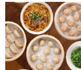
3日目昼食 鼎泰豊 点心料理

中国歴代の書画、銅器、磁器、玉細工など美術品の所蔵数は世界最大規模を誇る博物館。台湾観光では外せないスポットです。中国文化の精髓にふれることができます。