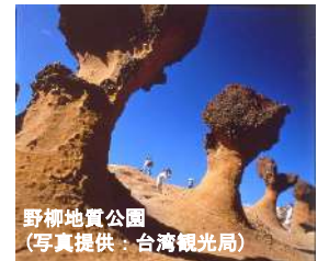
野柳地質公園