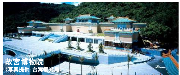
故宮博物院

中国歴代の書画、銅器、磁器、玉細工など美術品の所蔵数は世界最大規模を誇る博物館。台湾観光では外せないスポットです。中国文化の精髓にふれることができます。