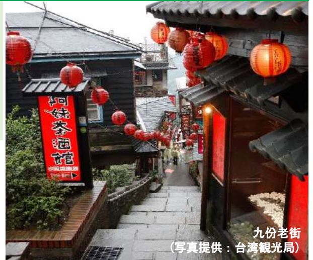
九份老街

※上記は予定スケジュールで、渋滞・混雑等で遅延なく運送機関が運行された場合です。運送機関並びに現地の諸事情により、スケジュールや観光箇所が変更となる場合があります。 ※食事の順序は変更となる場合があります。