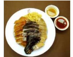
3日目夕食 鶏家荘 三色蒸鶏