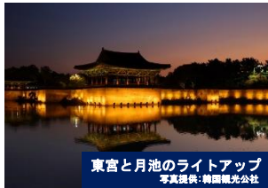
東宮と月池のライトアップ

韓国伝統の仮面・タルとその仮面を用いる踊る仮面舞・タルチュムをテーマにした楽しいお祭りです。世界遺産・安東河回村に伝承されている「河回別神グツ仮面劇」をはじめ、韓国全国の様々な仮面舞や海外の仮面舞などさまざまな公演が行われます。