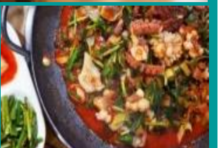
釜山名物 ナクチポックン(イマツ)

韓国絶品グルメ30選とは、日本の旅行業界のプロが選んだ韓国のご当地グルメです。名物料理を本場で楽しみたい方におすすめです。