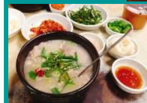
釜山名物 テジクッパ(豚肉スープご飯) (イマツ)