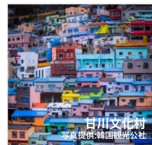
甘川文化村