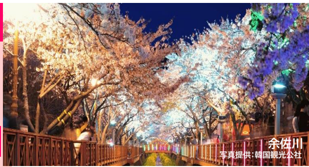
余佐川 写真提供:韓国観光公社

出発日と旅行代金 3月22日(土) 154,800円 (2名1室 大人おひとり様)