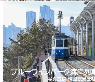
ブルーラインパーク海岸列車