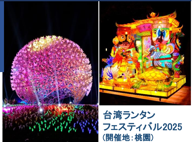
台湾ランタンフェスティバル2025 (開催地:桃園)

※上記は予定スケジュールで、渋滞・混雑等で遅延なく運送機関が運行された場合です。運送機関並びに現地の諸事情により、スケジュールや観光箇所が変更となる場合があります。