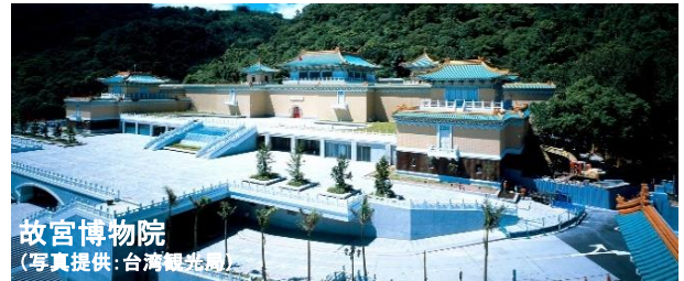
故宮博物院

中国歴代の書画、銅器、磁器、玉細工など美術品の所蔵数は世界最大規模を誇る博物館。台湾観光では外せないスポットです。中国文化の精髓にふれることができます。