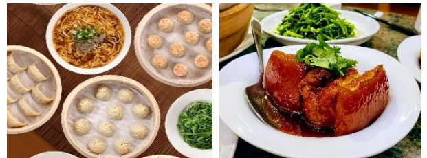
3日目昼食 鼎泰豊 点心料理

中国歴代の書画、銅器、磁器、玉細工など美術品の所蔵数は世界最大規模を誇る博物館。台湾観光では外せないスポットです。中国文化の精髓にふれることができます。