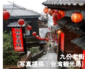
九份老街 (写真提供:台湾観光局)

台湾最大のお祭りで、テーマに沿った巨大なランタンや無数のランタンが会場に飾られます。旧暦1月15日からおよそ2週間に渡り開催され、多くの人でにぎわいます。(写真は過去開催時の様子です。写真提供:台湾観光局)