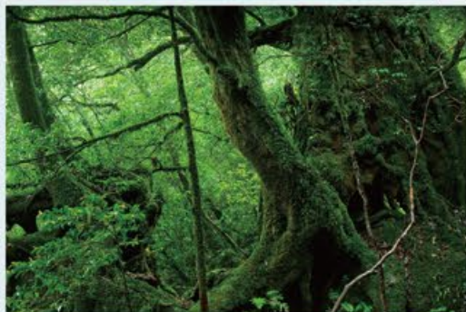
白谷雲水峡 ~ 迷い込むもののけの世界

映画もののけ姫の舞台となったことで知られる。屋久島の深い神秘の森を体感できる場所。