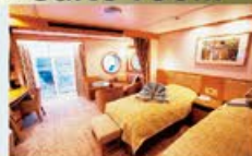
ビスタスイート 37㎡-42㎡・2名1室利用