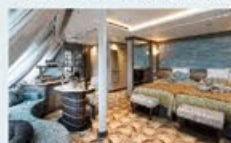
オーシャンビュースイート 33㎡・2名1室利用