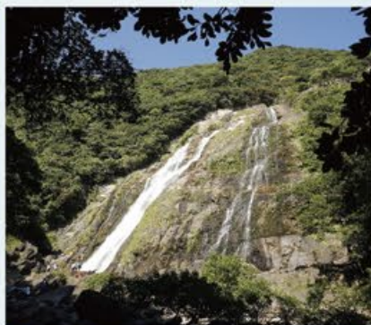
大川の滝 ~ 豪快に轟く姿は圧巻！

マイクロバスでしか入れない細い道を進む。島固有の鹿や猿が頻りに出て来てくれます。