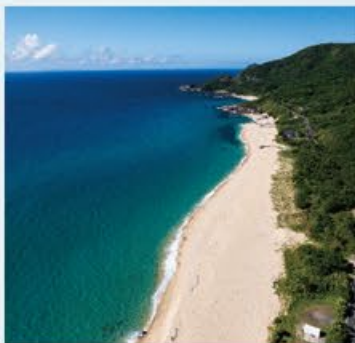
いなか浜 ~ 海亀の来る浜

映画もののけ姫の舞台となったことで知られる。屋久島の深い神秘の森を体感できる場所。