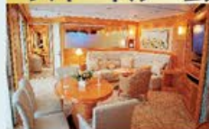
グランドスイート 79㎡・2名1室利用