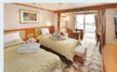
ジュニアスイート 31㎡・2名1室利用