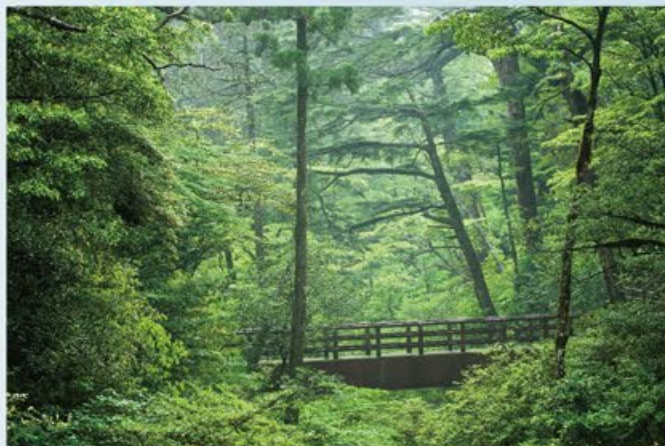
ヤクスギランド ~ 散歩で感じる千年の歴史

名前こそ可愛い感じですが、一步踏み込むとそこは私達が想像する鬱蒼とした屋久島の森そのもの。実は白谷雲水峡よりも高度も高い。屋久杉を見るならとてもお勧めです。