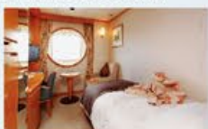
デラックスシングル 13㎡・1名1室利用