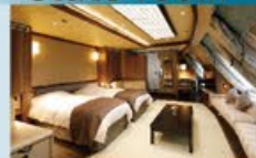
スーペリアコンセプトルーム 42㎡・4~5名1室利用