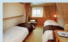
コンフォートステート 14㎡・2~3名1室利用