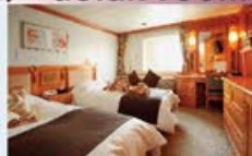
デラックスツイン 19㎡・2名1室利用