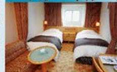
スーペリアツイン 14~18㎡・2~3名1室利用