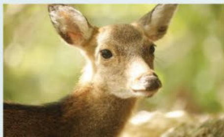
西部林道 ~ ヤクシカの待つ世界遺産地域

名前こそ可愛い感じですが、一步踏み込むとそこは私達が想像する鬱蒼とした屋久島の森そのもの。実は白谷雲水峡よりも高度も高い。屋久杉を見るならとてもお勧めです。