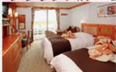
デラックスペランダ 24㎡・2名1室利用