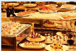
年末年始ディナービュッフェ (イメージ)