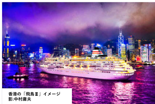
香港の「飛鳥Ⅱ」イメージ

海外クルーズならではの特別なイベント(鏡開きやデッキディナーなど)もお楽しみいただけます。