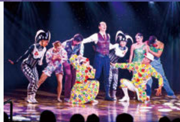
オリジナルプロダクションショー