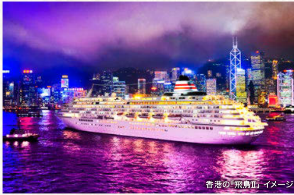
香港の「飛鳥II」イメージ