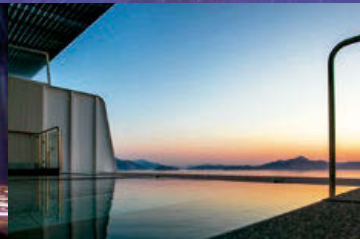
露天風呂で至福のくつろぎを