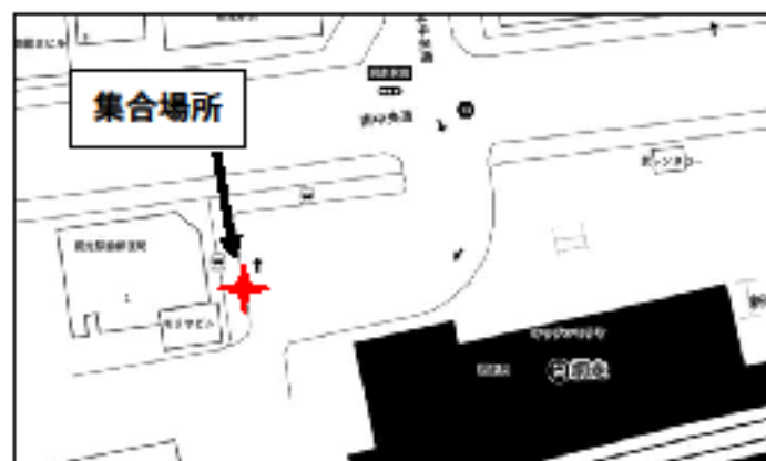
①JR網走駅前 集合5:45 出発6:00