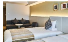
ツインルームイメージ