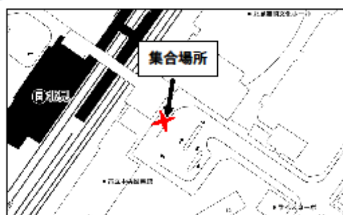
④JR北見駅ロータリー側 出発7:20