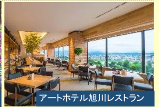
アートホテル旭川レストラン