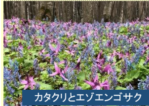
カタクリとエゾエンゴサク

カタクリ、エゾエンゴサクが見頃をむかえる突哨山を歩きます。昼食は旭川を一望できるレストランでランチビュッフェ。温泉入浴もお楽しみいただけます。