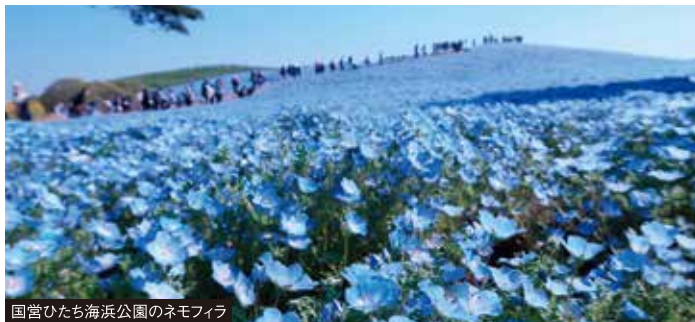
国営ひたち海浜公園のネモフィラ