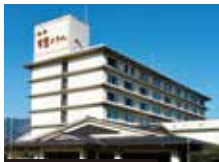
石和常磐ホテル 外観