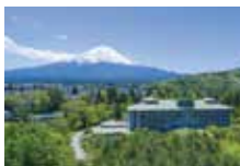
富士ビューホテル外観

1日目/河口湖:富士ビューホテル 和室または洋室利用(バス・トイレ付) 2日目/石和温泉:石和常磐ホテル 和室または和室ベッド(バス・トイレ付)