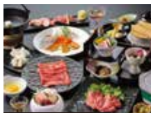
石和常磐ホテル 夕食