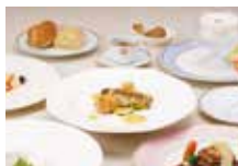
富士ビューホテル夕食