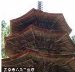
安楽寺八角三重塔