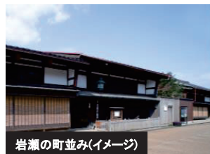
岩瀬の町並み(イメージ)