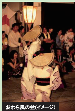
おわら風の盆(イメージ)