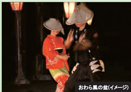
おわら風の盆(イメージ)

八尾の町が最も賑い、輝きが増す秋。9月1日から三日三晩にわたって繰り広げられるおわら風の盆は優美な踊り、胡弓や三味線の哀愁を帯びた旋律、情緒豊かな歌声が小さな坂の町を彩り、全国から訪れる人達を魅了します。