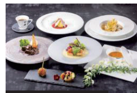
夕食 富れんち(イメージ)