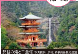
那智の滝と三重塔