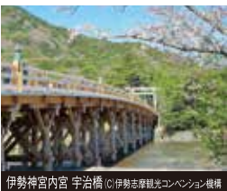
伊勢神宮内宮 宇治橋