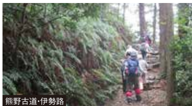
熊野古道・伊勢路