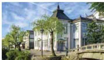
倉敷美観地区

個性ある観光資源を持つ東瀬戸の三都市(倉敷市、鳴門市、琴平町)が手を結び、共同で観光促進を進めている瀬戸内三都をめぐる旅。徳島では「阿波人形浄瑠璃」の鑑賞など伝統芸能も楽しめます。