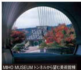
MIHO MUSEUMトンネルから望む美術館棟

※紅葉の状況に関しましては気候条件によりご満足いただけない場合もあります。 ※展覧会名、内容は変更となる場合があります。