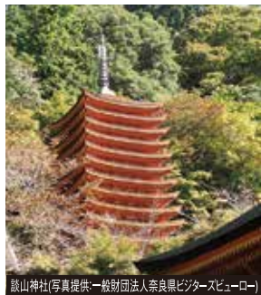
談山神社

巨石30個を積み上げて造られた石室古墳。6世紀の築造で、その規模は日本最大級を誇ります。古墳を彩る桜もお楽しみください。