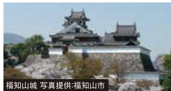
福知山城