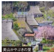
美山かやぶきの里