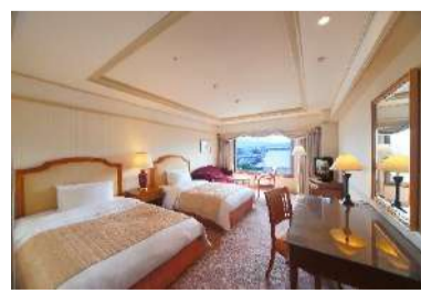
ホテル日航プリンセス京都 外観・客室一例