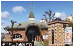
夢二郷土美術館本館

夢二郷土美術館本館 故郷への思いを募らせた夢二の想いを 酌み1966年に名勝後楽園の外苑 に建てられました。