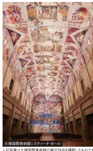
大塚国際美術館「スティナー・ホール」