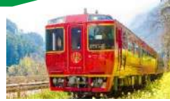
四国まんなか千年ものがたり