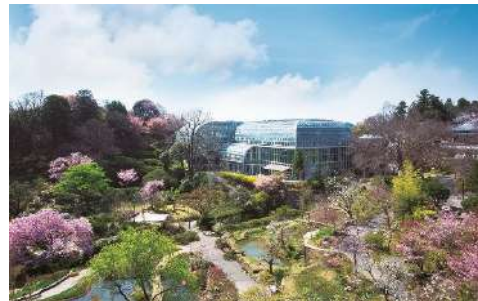
高知県立牧野植物園イメージ

高知が生んだ植物分類学の父牧野富太郎博士を記念した植物園で、およそ3,000種類の植物を見ることができます。2月の時期は梅・カンヒザクラ・バイカオウレンがご覧いただけます。