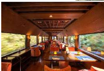
重厚で落ち着いた車内